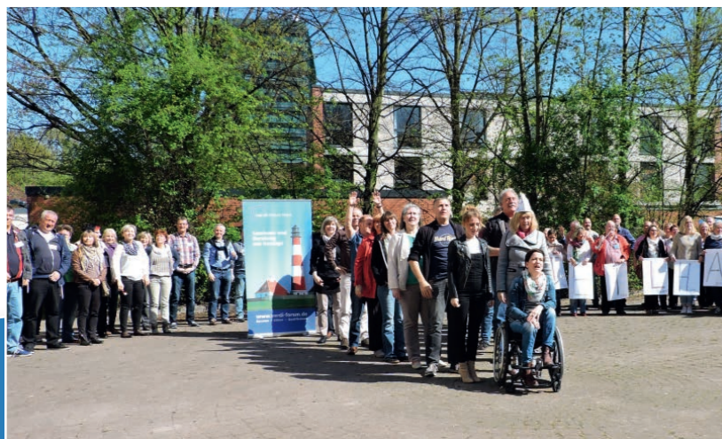
„Es ist 5 vor 12!“ – Flashmob zum BTHG 2016

Eure / Ihre Teams vom ver.di Forum Nord und dem Bildungswerk ver.di in Niedersachsen