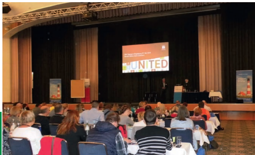
SBV Fachtagung 2018

Eure/Ihre Teams vom ver.di Forum Nord und dem Bildungswerk ver.di Niedersachsen.